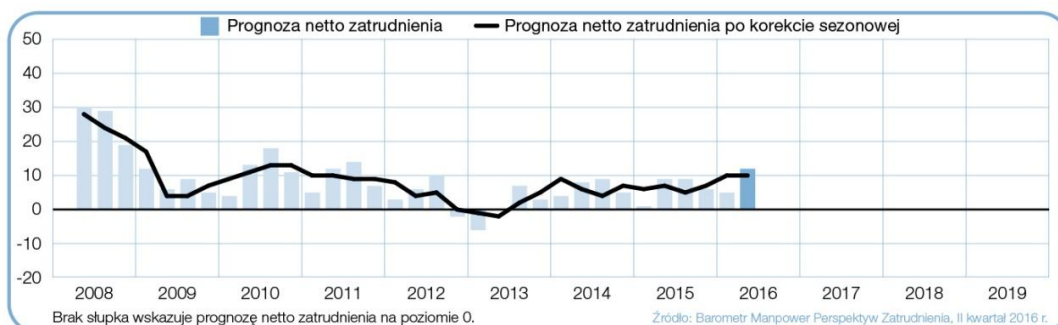
Wykres 1. Prognoza netto zatrudnienia dla Polski w ciągu kolejnych kwartałów. Źródło: Raport „Barometr Manpower Perspektyw Zatrudnienia”.