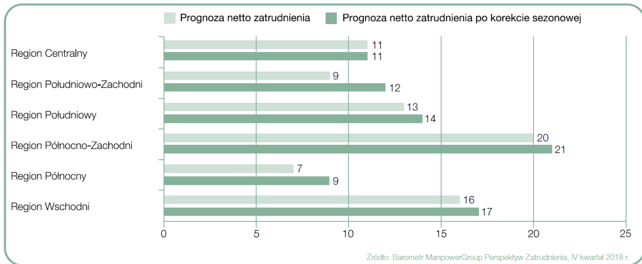
Wykres 3. Prognoza netto zatrudnienia dla regionów Polski na Q4 2018 r.; podział wg Eurostat.

W porównaniu do poprzedniego kwartału plany zatrudnienia poprawiły się w czterech z sześciu regionów. Największa poprawa dotyczy Polski północno-zachodniej, gdzie prognoza jest wyższa o 7 punktów procentowych. Plany pogorszyły się w Polsce północnej, o 4 punkty procentowe, oraz południowo-zachodniej o 1 punkt procentowy.