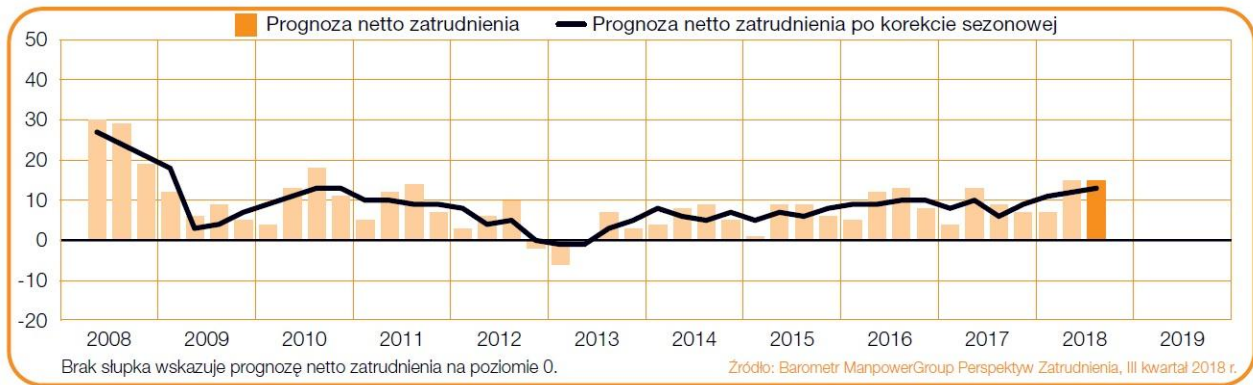
Wykres 1. Progniza netto zatrudnienia dla Polski w ciągu kolejnych kwartałów.