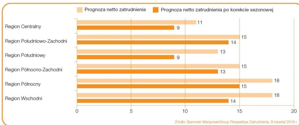
Wykres 3. Prognoza netto zatrudnienia dla regionów Polski na Q3 2018 r.; podział wg Eurostat.

W ujęciu kwartalnym plany rekrutacyjne polskich pracodawców poprawiły się w 4 z 6 regionów, pogorszyły w 2. Największy wzrost dotyczy regionów Wschodniego, Północnego i Północno-Zachodniego (o 3 punkty procentowe), a największy spadek regionu Centralnego (o 3 punkty procentowe). W ujęciu rocznym w 5 regionach odnotowano wzrost prognozy, największy dla regionu Północ (o 11 punktów procentowych), dla regionu Południe plany pracodawców pozostały bez zmian.