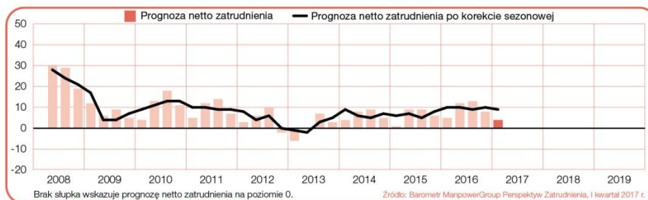
Wykres 1. Prognoza netto zatrudnienia dla Polski w ciągu kolejnych kwartałów. Źródło: „Barometr ManpowerGroup Perspektyw Zatrudnienia”.