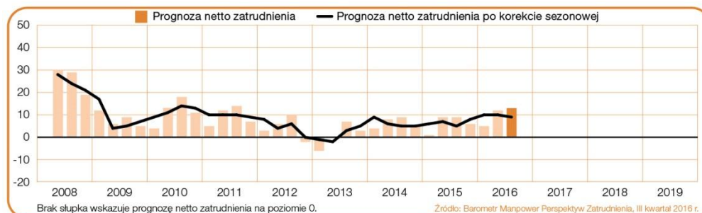
Wykres 1. Prognoza netto zatrudnienia dla Polski w ciągu kolejnych kwartałów. Źródło: Raport „Barometr Manpower Perspektyw Zatrudnienia”.